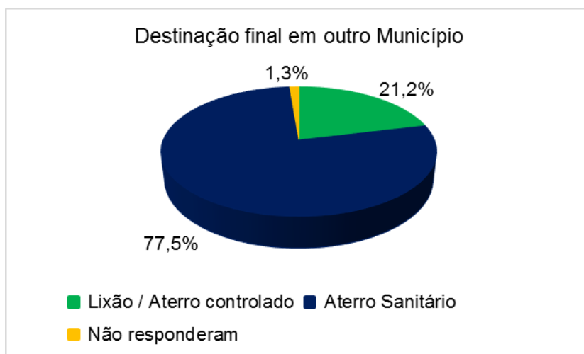
Figura 3. Disposição final externa. Elaboração: CNM

Em contrapartida, dos 35,3% que destinam os resíduos sólidos para outro Município, a grande maioria faz a disposição final adequada, o que comprova o esforço dos gestores em cumprir a PNRS. O total de 77,5% consegue dispor os resíduos sólidos apenas em aterros sanitários (Figura 3), o que representa 1.149 Municípios, dos 1.482 Municípios que informaram à CNM fazer essa disposição final em outro Município.