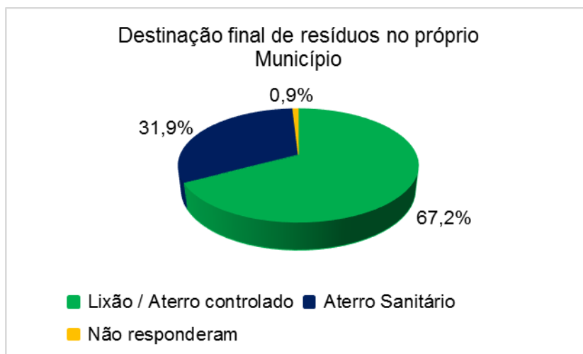
Figura 2. Disposição final local. Elaboração: CNM

Em contrapartida, dos 35,3% que destinam os resíduos sólidos para outro Município, a grande maioria faz a disposição final adequada, o que comprova o esforço dos gestores em cumprir a PNRS. O total de 77,5% consegue dispor os resíduos sólidos apenas em aterros sanitários (Figura 3), o que representa 1.149 Municípios, dos 1.482 Municípios que informaram à CNM fazer essa disposição final em outro Município.