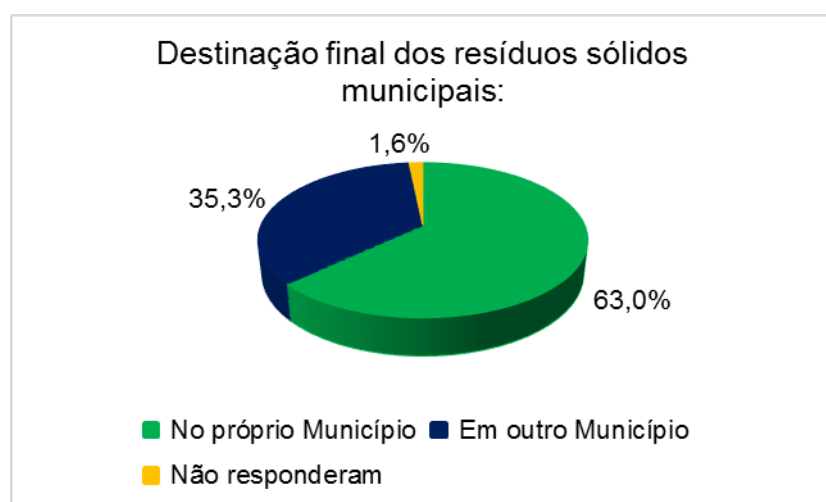
Figura 1. Destino da disposição final. Elaboração: CNM

Assim, faz-se necessário ressaltar que existe uma grande diferença no que se refere à localização dos locais de disposição final, pois 63% deposita os resíduos no próprio Município e 35,3% em outro Município (Figura 1).